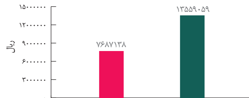
متوسط سرانه پرداخت مستقیم از جیب در جمعیت‌های با سرپرست خانوار سالمند (بالای ۶۵ سال) و در سطح کل جمعیت (ریال در سال)